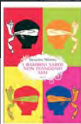
Gesuino Némus (Matteo Locci) e il suo libro