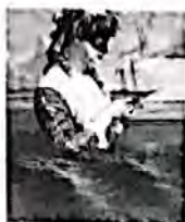
LA DIVINA INTERFERENZA

Oggi alle 21, sala Intrepidi Monelli (V.le S. Avendrace 100) in scena musicisti, attori, ballerini e cantanti. Info: 3206835292