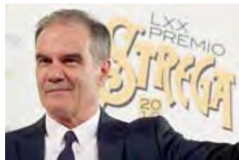
Edoardo Albinati, vincitore del Premio Strega 2016