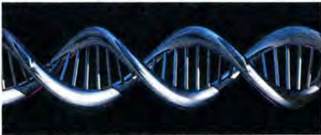
Qui sopra la sequenza del Dna, foto dell'anno 2001, generata da un computer. In alto la celebre immagine della Creazione di Michelangelo

Breve cronistoria del rapporto tra la scienza dei numeri e la teologia