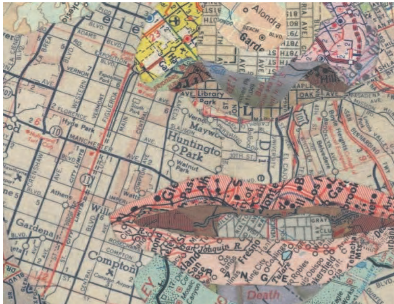
Mappe, volti Matthew Cusick, «Red & Blue», 2010

Ogni città è un palinsesto, un documento sul quale si continua a scrivere, giorno dopo giorno, secolo dopo secolo, senza che nulla venga davvero perduto. Magari nel nome di una via, nella pietra angolare di un edificio, nei ricordi dei suoi abitanti; la memoria, nelle città, non si fa tempo, si fa spazio. Ogni città racchiude in sé il passato e il futuro, il suo talento e la sua vocazione. Le città sono la scommessa dell'umanità, il luogo