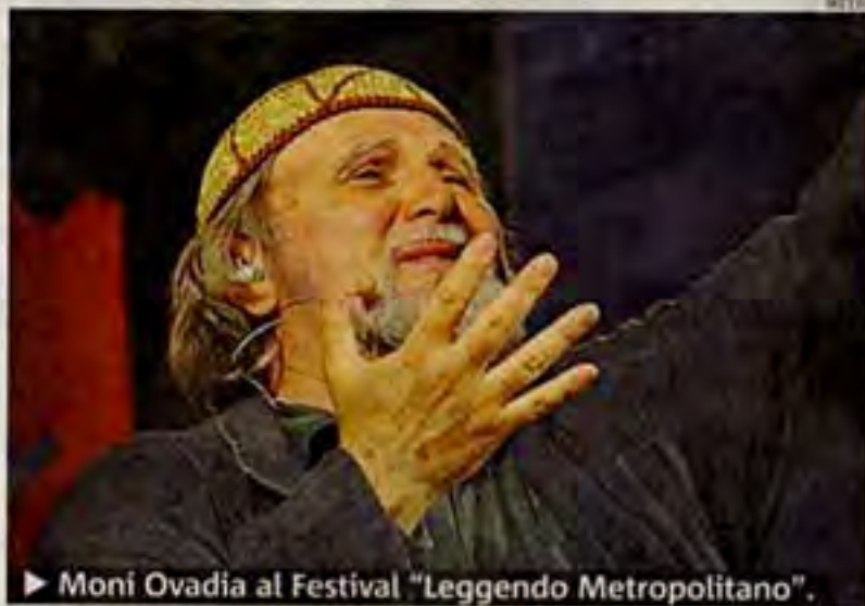
► Moni Ovadia al Festival "Leggendo Metropolitano".

IL FESTIVAL Moni Ovadia, Piergiorgio Odifreddi, Igiaba Scego, Giorgio Ficara tra i tanti ospiti della terza edizione del festival "Leggendo Metropolitano", organizzata dalla Associazione Prohairesis, con la direzione artistica di Saverio Gaeta. Quest'anno, focus su un tema mai esausto: le radici. Dal 2 al 5 giugno le strade, le case, la gente dello storico quartiere Castello di Cagliari diventeranno protagonisti di una grande festa dell'identità, parola spesso usata (a volte anche abusata) che, come dice Claudio Magris, «non indica un rigido dato immuta-