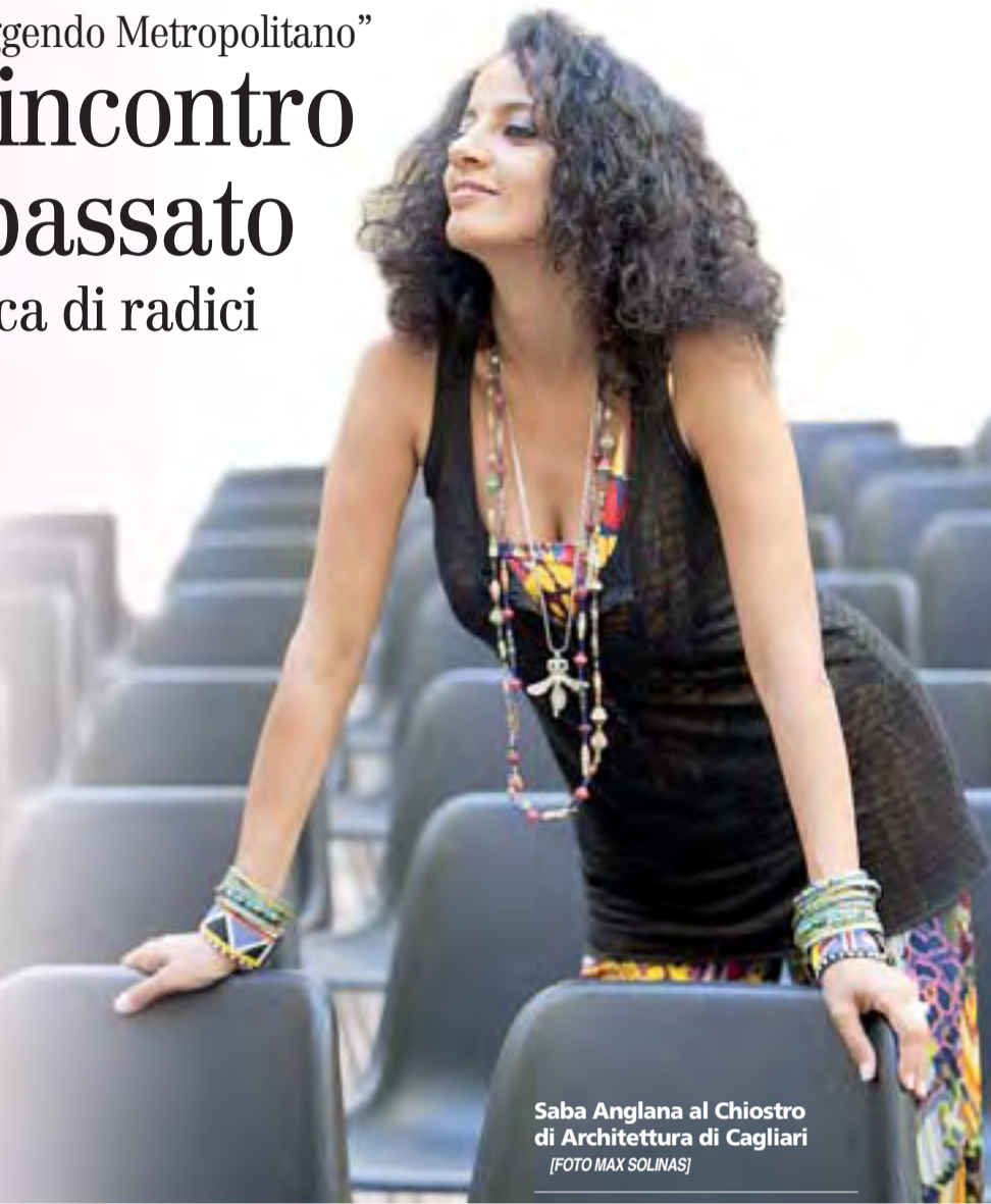
Saba Anglana al Chiostro di Architettura di Cagliari

Il matematico saggista ha aperto la rassegna culturale con una "lectio magistralis" Odifreddi tra fede e ragione Ecco i "brevi cenni sull'universo" dell'alfiere della laicità