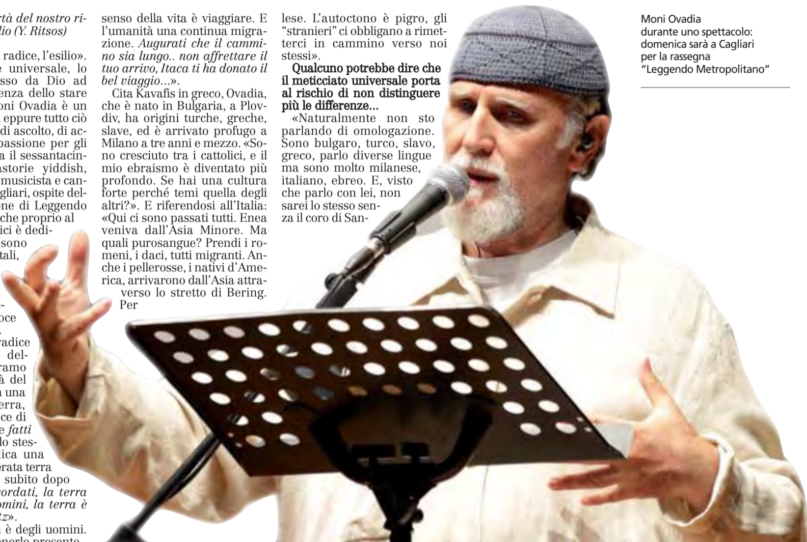
Moni Ovadia durante uno spettacolo: domenica sarà a Cagliari per la rassegna "Leggendo Metropolitan"

«Naturalmente non sto parlando di omologazione. Sono bulgaro, turco, slavo, greco, parlo diverse lingue ma sono molto milanese, italiano, ebreo. E, visto che parlo con lei, non sarei lo stesso senza il coro di San-