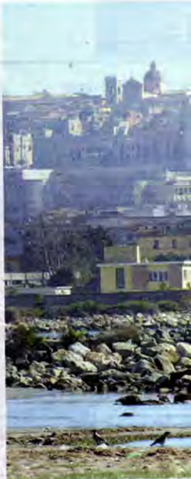
Cagliari vista da Giorgino