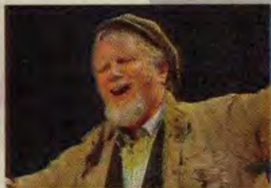
Moni Ovadia oggi a Cagliari

CAGLIARI. Finisce oggi la rassegna cagliaritano di «Radici-cartografie del futuro», terza edizione di Leggendo Metropolitano. Alle 10,30 in via Santa Croce presso la Sala delle Mura apre la quarta giornata di