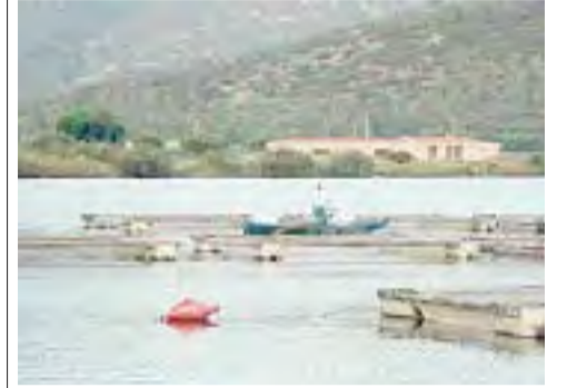
Lo stagno di Feraxi

Sono stati appaltati a Muravera i progetti per il recupero degli stagni. La lunga attesa dei pescatori è insomma finita. Per Colostrai-Le Saline è previsto il dragaggio dei fondali, con l'eliminazione della sabbia e della fanghiglia dalla bocca dei moli. Ma anche la creazione di isolotti per l'avifauna. Da realizzare pure le strade di accesso al compendio con fini soprattutto naturalistici e turistici.