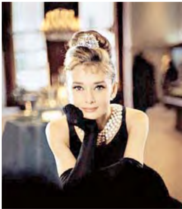
Audrey Hepburn sul set di "Colazione da Tiffany"

Semplicemente elegante. Portamento aristocratico, sguardo da cerbiatta, una classe, disciplinata e sobria, non sgretolata e provocatoria. Audrey Hepburn ha incarnato l'ideale degli anni '50, di perfezione senza macchia. E se Brigitte Bardot ha scelto Saint Tropez, Jackie Kennedy si è invaghita di Capri e Liz Taylor ha optato per Acapulco, la diva di Colazione da Tiffany ha avuto un solo amore: Roma.