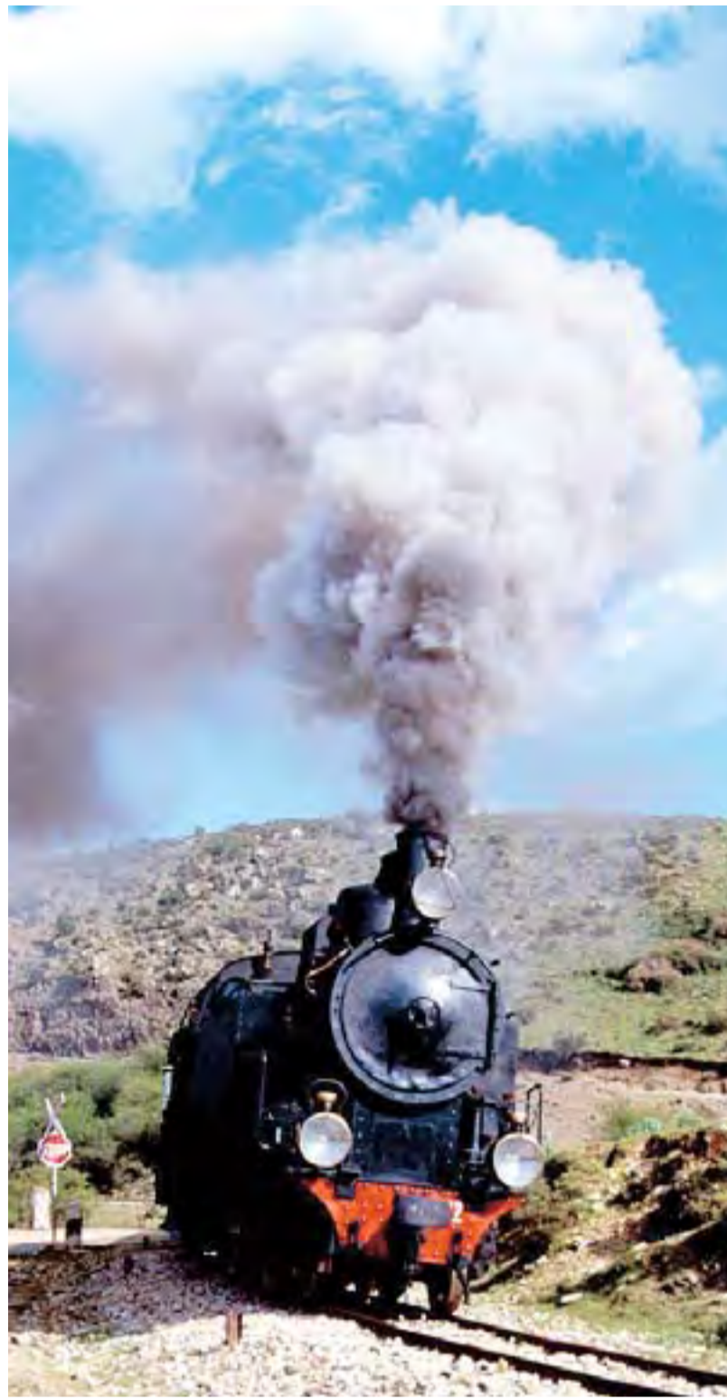
Il Trenino verde